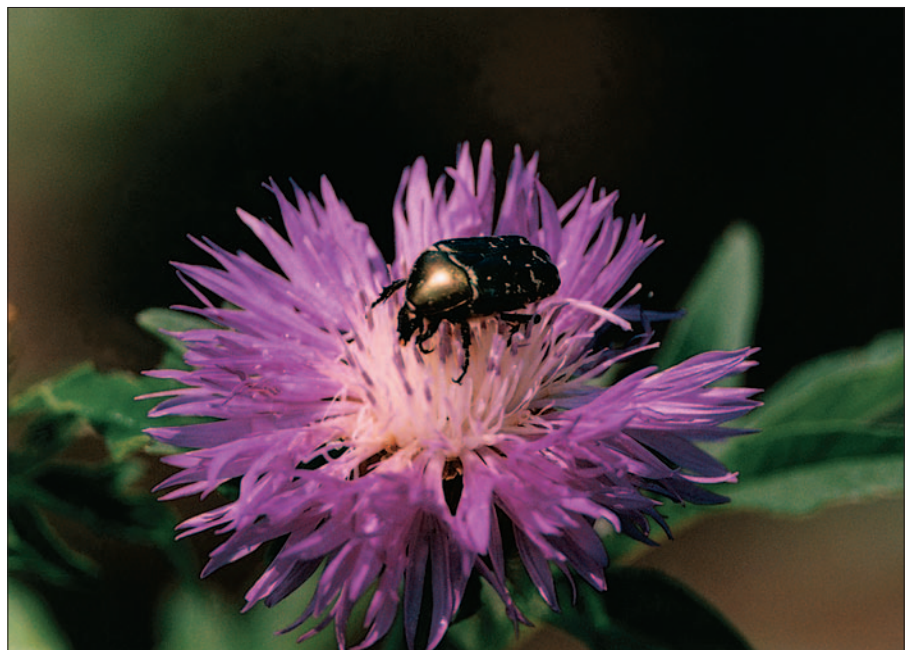
Королівський сніданок.

14. ЦДАВОВ України. — Ф. 1064, оп. 3, спр. 1, арк. 114.