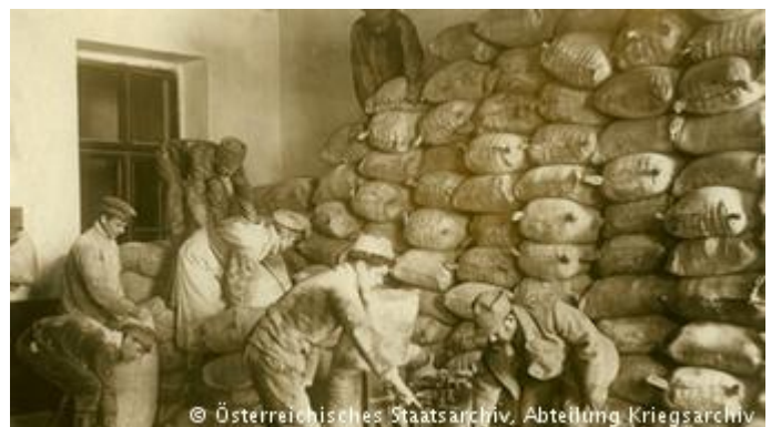
Збіжжя перед відправкою до Австрії

29 квітня у Києві проходив Хліборобський конгрес, на який прибули близько шести тисяч делегатів з усієї України - передовсім середні і великі землевласники, невдоволені хаотичною земельною політикою Центральної Ради. Річ у тім, що Третім універсалом УНР, ухваленим у листопаді 1917 року, зокрема, було скасоване приватне право власності на землю - її "передали трудящим", при цьому жодного механізму розподілу паїв не передбачалося. "На селі панував хаос. Землю нерідко захоплювали ті, в кого була зброя. Навесні через невизначеність щодо того, кому належить земля, фактично не починалася посівна", - розповідає у розмові з DW історик Павло Гай-Нижник. Конфронтація союзників - німців і австрійців - з урядом Всеволода Голубовича наростала: під загрозою були поставки збіжжя, прописані у мирному договорі, гостро необхідні з огляду на напружену ситуацію з продовольством у Берліні і Відні. Зрештою, втративши терпіння, німецьке військове командування видало наказ про примусовий посів.