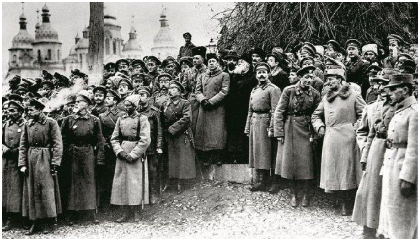
Симон Петлюра, Володимир Винниченко та Михайло Грушевський

арештувати на нетривалий час й кількох правих проросійських діячів (Гіжицького, Кумбарта та ін). При цьому Павло Скоропадський власноручно склав список з 15–20 осіб.