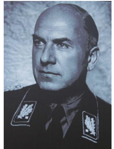
На світдині: Ф.Тодт – керівник німецької військово-будівельної організації «Тодт», що споруджувала «Вервольф»

На будівництві бункера (1941–1942) працювало бл. 10 тис. радянських військовополонених, 1 тис. 425 іноземців і 995 місцевих мешканців. 2 тис. осіб загинуло від голоду і морозів, ще 4 тис., які звільнилися після завершення зовнішніх робіт, розстріляні в ніч з 11 на 12 січня 1942 р. У німецькому донесенні від 10 квітня 1942 р. повідомлялося про майже повне завершення багатьох робіт. У той час на будівництві були задіяні 4 тис. 086 робітників, в тому числі 991 громадянин Німеччини, 1 тис. 495 іноземців, приблизно 500 солдатів будівельних батальйонів, бл. 1 тис. 100 військовополонених. На виконання внутрішніх робіт у березні 1942 р. було зігнано 227 українських євреїв із Стрижавки, також страчених по завершенні робіт (загалом були знищені всі, хто знав влаштування бункера та його комунікацій). У квітні 1942 р. військовополонені, які залишилися живими, були вивезені і їхня доля невідома. Таємницею вкрито й історію зникнення групи архітекторів та проєктантів об'єкту. Відомо лише, що на їх честь з нагоди закінчення робіт організували прощальний обід, їм вручили урядові нагороди. Після урочистостей ті особи сіли до літака, що узяв курс на Німеччину, проте вже за кілька хвилин після зльоту літак вибухнув.