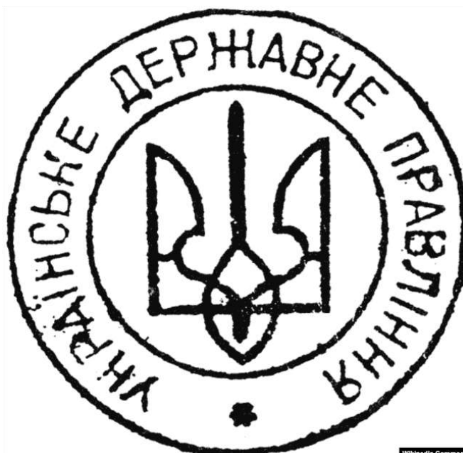
Печатка Українського Державного правління

Тут треба розуміти, що це революційна організація, яка проголошувала, принаймні у 1940-1941 роках, свою зверхність, свій провід над державою. Решта мали або прийняти їхню ідеологію і погоджуватися, або були б усунуті.