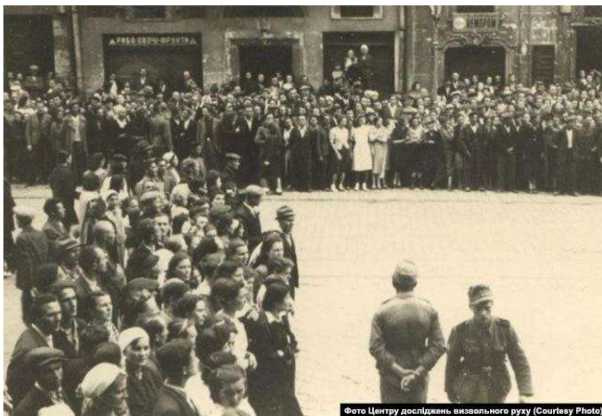
Львів'яни, які зібрались на площі Ринок, щоб послухати проголошення Акту відновлення Української Держави, 30 червня 1941 року

– Були свідомі. Ба навіть сама назва «революційний Провід» спонукала до того, що вони були готові до самопожертви. І про це свідчить їхня поведінка, зокрема Степана Бандери на польських судах, і вирок, який він отримав, і те, як він його сприйняв. Тому вони були готові до самопожертви.