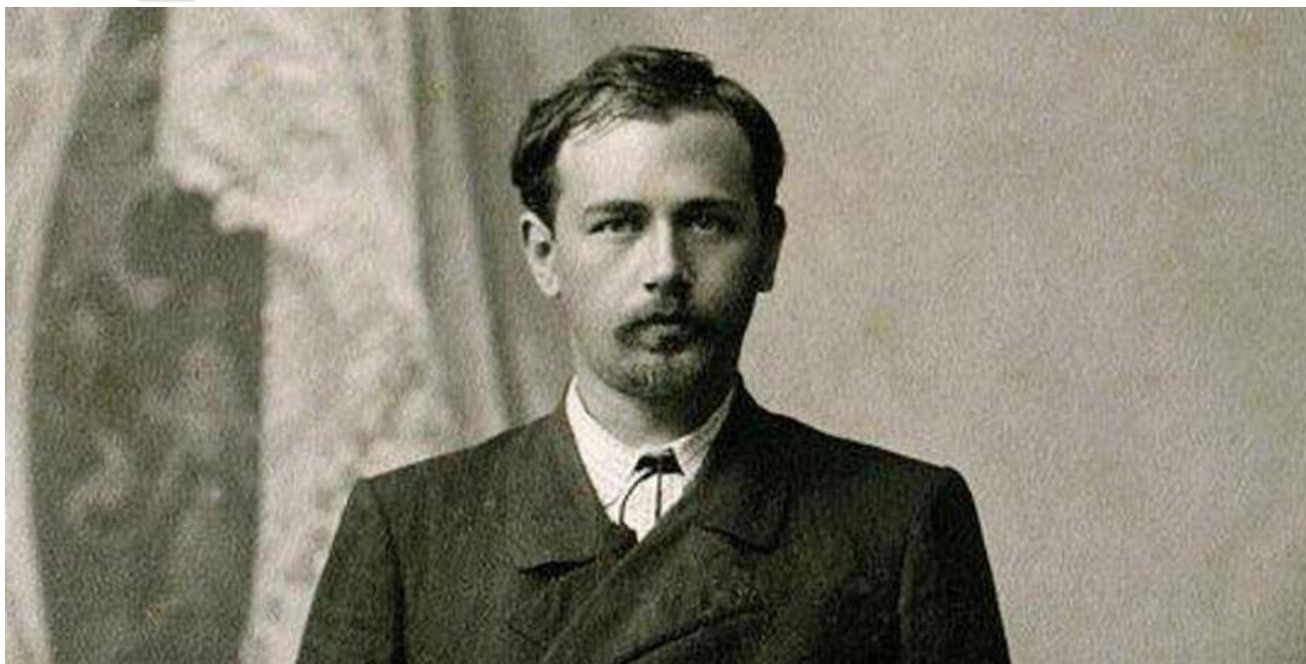
Фото: Николай Леонтович, автор легендарного "Щедрика"

100 лет назад, в ночь на 23 января 1921 года, в селе Марковка Подольской губернии выстрелом из обреза убили автора "Щедрика" Николая Леонтовича. До своего мирового признания он не дожил несколько месяцев