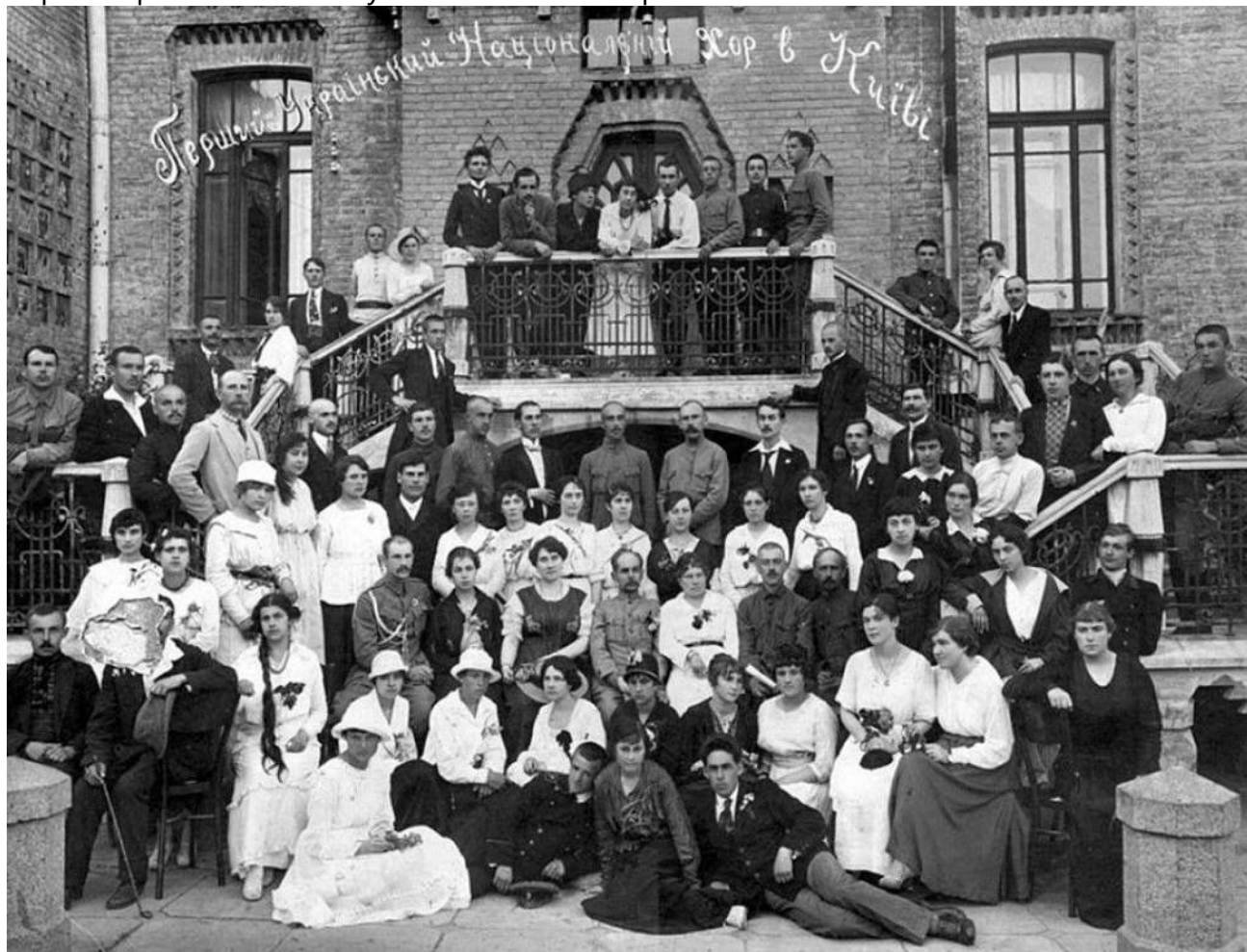
Киевский хор. Николай Леонтович среди участников Первого украинского национального хора

Леонтовича включили в репертуар Второй путешествующей капеллы "Днепросоюза", во время концерта в Тульчине восхищенные зрители указывали на него и тихо переговаривались: "Этот учитель и есть автор!".