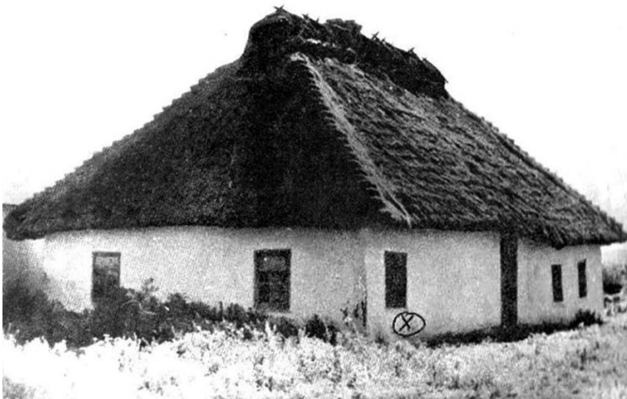
Место убийства. Дом отца в Марковке сохранился только на старом фото — крестиком отмечен угол, в котором застрелили композитора