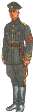
Старшина 1-го Гуцульського полку морської піхоти. квітень 1919 р.

Перше бойове хрещення полк здобув 5 травня 1919 р. під Волочиськом при переправі через Збруч з Галичини в боях з більшовиками 19 .