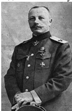
Адмірал Андрій Покровський

Як і в Одесі, у Миколаєві були розташовані два інженерні взводи (телеграфний і телефонний), а в Очакові – піврота саперів і мотоциклетна команда. II-й відділ сухопутної оборони обслуговували радіостанції Миколаєва та Очакова. Активно почав формуватися особовий склад дивізій. Було також вирішено укомплектувати артилерію морської піхоти 76 мм гірськими гарматами Шнайдер-Дангліса зразка 1909 р., по шість гармат на батарею (таке рішення обумовлювалося тим, що така гармата має відносно малу вагу, порівняно з звичайною польовою гарматою, й відтак є легкою у передислокації) 14 .