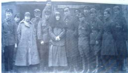
Група українських морських піхотинців, інтернованих в польських таборах, 1920 р

кістяком у горлі зупиненої атаки більшовицької 1-ї Кінної армії С. Будьонного та військ М. Тухачевського. Крім того, 21 листопада 1920 р. на берегах Збруча під Підволочиськом саме морський курінь, підтримуваний вогнем бронепотяга, забезпечив відхід українського війська і до останнього тримав бій з ворогами. «Чорноморець» із загоном морської піхоти останнім залишив землю Великої України та перейшов Збруч. Після ж укладеного поляками 9 листопада 1920 р. перемир'я з більшовиками, українські морські піхотинці були інтерновані поляками ж в таборах Олександрів, Каліш, Щепюрно.