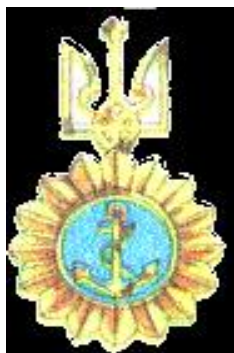
Кокарда підстарший флоту Української Держави (липень 1918 р.)