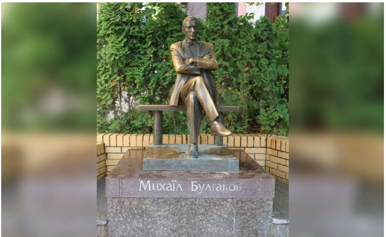
Пам'ятник Булгакову біля будинку, де він жив, на Андріївському узвозі.

Навіть більше – можливо, для когось це відкриття, але більшість з нині відомих і поважних українських письменників, діячів, які сиділи в тюрмах Союзу і зараз приписані до дисидентів, ніколи не домагалися самостійної України. Навіть не заперечували радянський лад, а просто хотіли того, що записано було в тамтешній Конституції – забезпечити всім рівні права на розвиток національної культури.