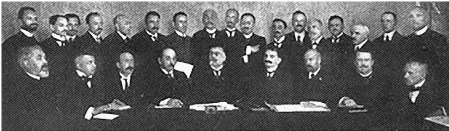
Головна Українська Рада. 1915 рік